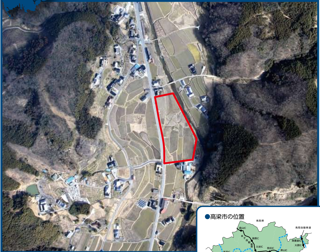
●用地位置図・区画図

●所在地／岡山県高梁市有漢町有漢 ●事業主体／高梁市 ●造成現況／造成中(分譲開始予定:平成30年度以降)