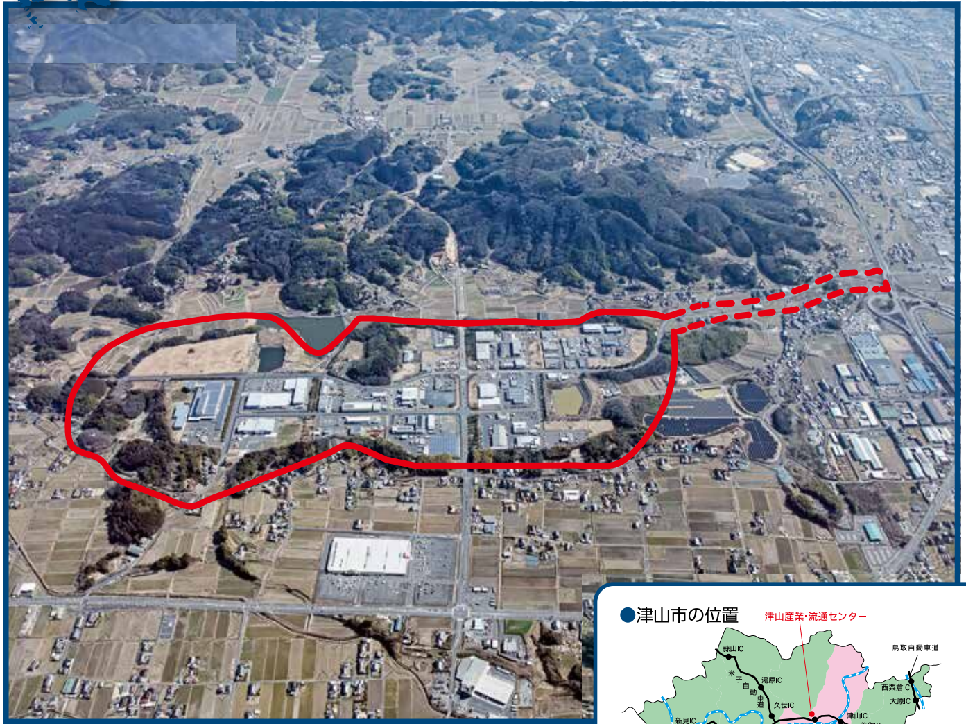
●用地位置図・区画図

●所在地/岡山県津山市戸島、上田邑、下田邑及び苫田郡鏡野町布原、沖 ●事業主体/津山市 ●造成現況/造成済(平成9年度完了)