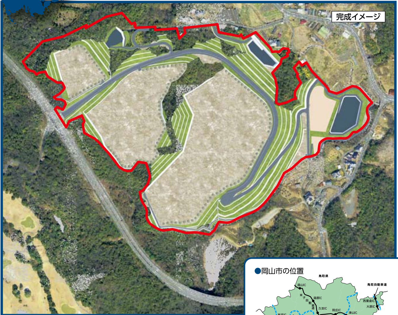
●用地位置図・区画図

●所在地／岡山県岡山市北区富吉 ●事業主体／岡山県・岡山市 ●造成現況／造成中(分譲開始予定:平成30年度以降)