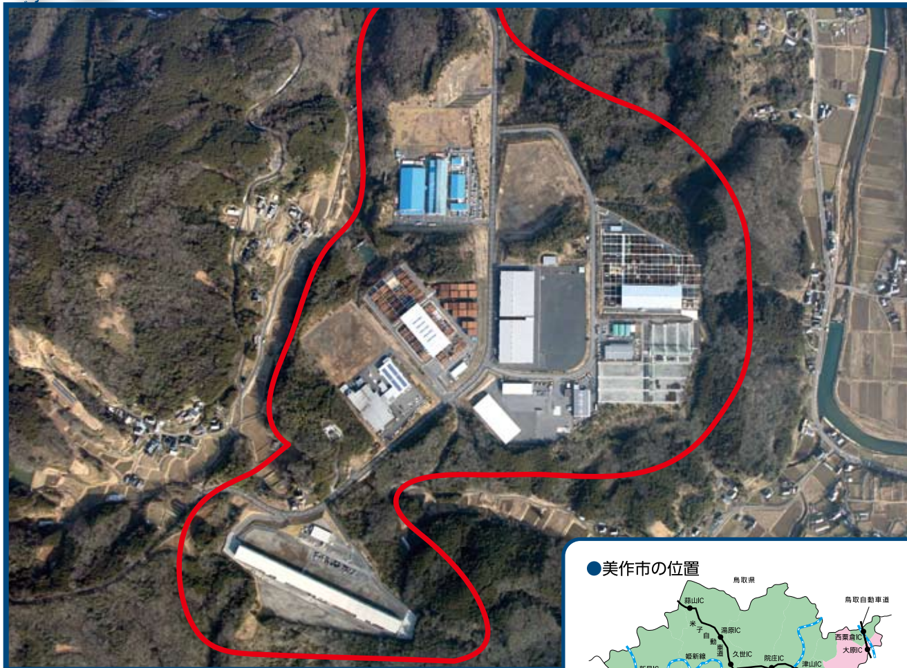
●用地位置図・区画図

●所在地／岡山県美作市竹田、上福原 ●事業主体／美作市土地開発公社 ●造成現況／造成済(平成10年度完了)